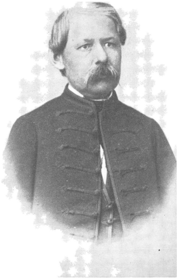
1. Arany János 1865-ben.